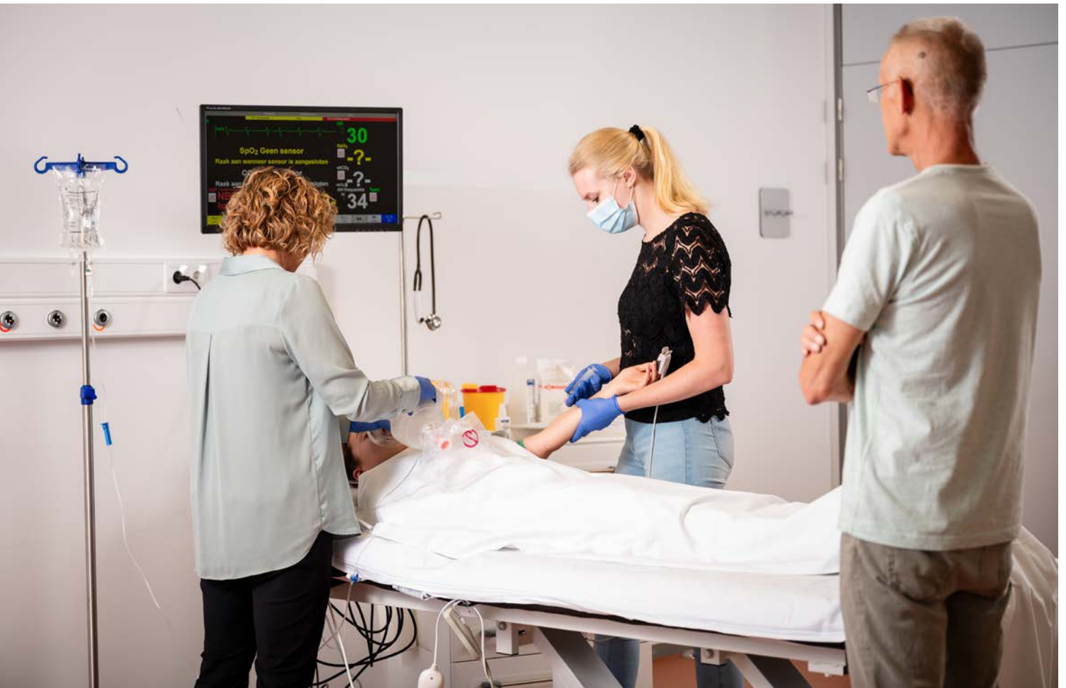
Aios donorarts.

Het blijft urgent om het aanhoudende tekort aan artsen binnen de sociale geneeskunde en eerste lijn aan te pakken. De tekorten blijven toenemen en zullen niet op korte termijn zijn opgelost. Dit project heeft een positieve ontwikkeling in gang gezet waarbij het extramurale geneeskundige domein is versterkt en onderlinge samenwerking is bevorderd. Deze verbinding draagt bij aan het gezamenlijk en integraal aanpakken van de tekorten aan extramuraal werkzame geneeskundigen.